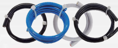
Alliance 压力传感专用线缆